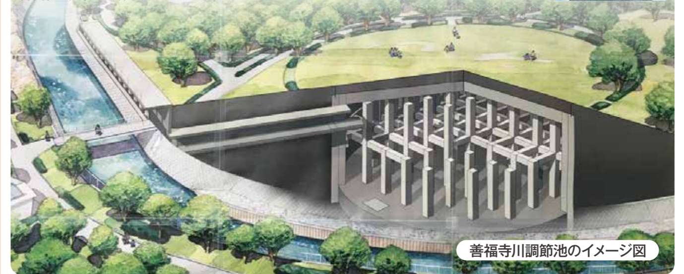
善福寺川調節池のイメージ図