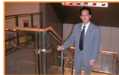
産業会館の階段・手摺り設置