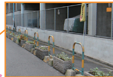
高架下プランター設置