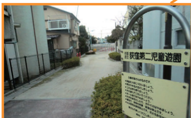
荻窪第2児童遊園の補修