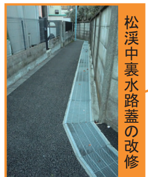
松浜中裏水路蓋の改修