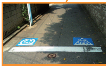
荻窪1丁目一時停止シールの設置