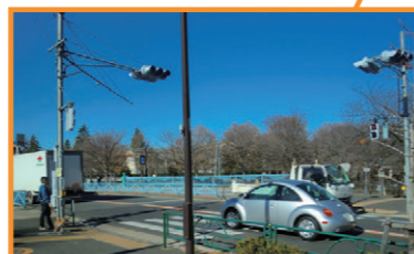
五日市街道の信号機移設