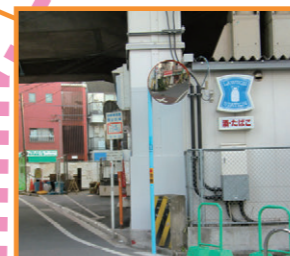
ふれあいの家前カーブミラー設置