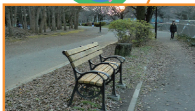
緑地公園思い出ベンチ設置