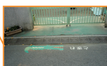
成田東4丁目道路標識補修