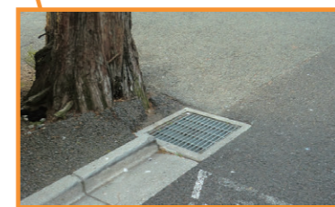
西原公園雨水ます改修