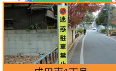
成田東1丁目駐車禁止看板設置