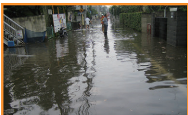
善福寺川水害復旧活動