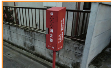
荻窪3丁目消火設備修理