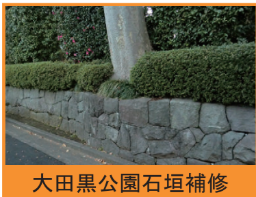
大田黒公園石垣補修