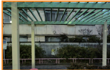
阿佐谷南公園藤棚補修